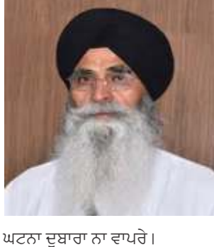
ਘਟਨਾ ਦੁਬਾਰਾ ਨਾ ਵਾਪਰੇ।

ਪਹਿਚਾਣ ਨੂੰ ਬਰਕਰਾਰ ਰੱਖਦਿਆਂ ਇਸ ਦੀ ਮੁੜ ਉਸਾਰੀ ਅਤੇ ਸੰਭਾਲ ਲਈ ਢੁੱਕਵੇਂ ਕਦਮ ਚੁੱਕੇ ਜਾਣ। ਉਨ੍ਹਾਂ ਕਿਹਾ ਕਿ ਪਾਕਿਸਤਾਨ ਵਿਚ ਸਥਿਤ ਗੁਰੂ ਸਾਹਿਬਾਨ ਨਾਲ ਸਬੰਧਤ ਗੁਰਦੁਆਰੇ ਅਤੇ ਹੋਰ ਸਿੱਖ ਵਿਰਾਸਤੀ ਅਸਥਾਨ ਵਿਸ਼ਵ ਭਰ ਦੀ ਸੰਗਤ ਦੀ ਆਸਥਾ ਦਾ ਕੇਂਦਰ ਹਨ। ਇਨ੍ਹਾਂ ਦੀ ਸੁਰੱਖਿਆ ਲਈ ਠੋਸ ਪ੍ਰਬੰਧ ਕੀਤੇ ਜਾਣੇ ਚਾਹੀਦੇ ਹਨ, ਤਾਂ ਜੋ ਭਵਿੱਖ ਵਿੱਚ ਇਸ ਤਰ੍ਹਾਂ ਦੀ ਕੋਈ ਵੀ